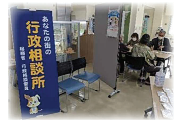
行政相談所（神奈川県横浜市）