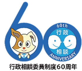
行政相談委員制度60周年

※相談所の開設日時や開設場所は行政苦情110番あるいは行政相談センターにお問い合わせいただくか、下記ページにアクセスして御確認ください。